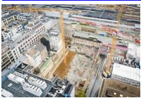
Avalanche de millions pour grands travaux en cascade

En effet, le ministre et les entreprises entendent bien profiter du calme régnant encore dans le pays confiné pour mettre les bouchées doubles sur certains sites stratégiques. Le meilleur exemple en est le chantier du tramway , au cœur de la capitale. A l'heure où la circulation est réduite au minimum et où seuls les commerces alimentaires fonctionnent en centre-ville, autant mettre hommes et engins à hauteur des croisements et non loin des rideaux baissés. Moins de gêne sur le trafic routier, aucun impact sur les commerces : voilà le but du changement de planification des interventions.