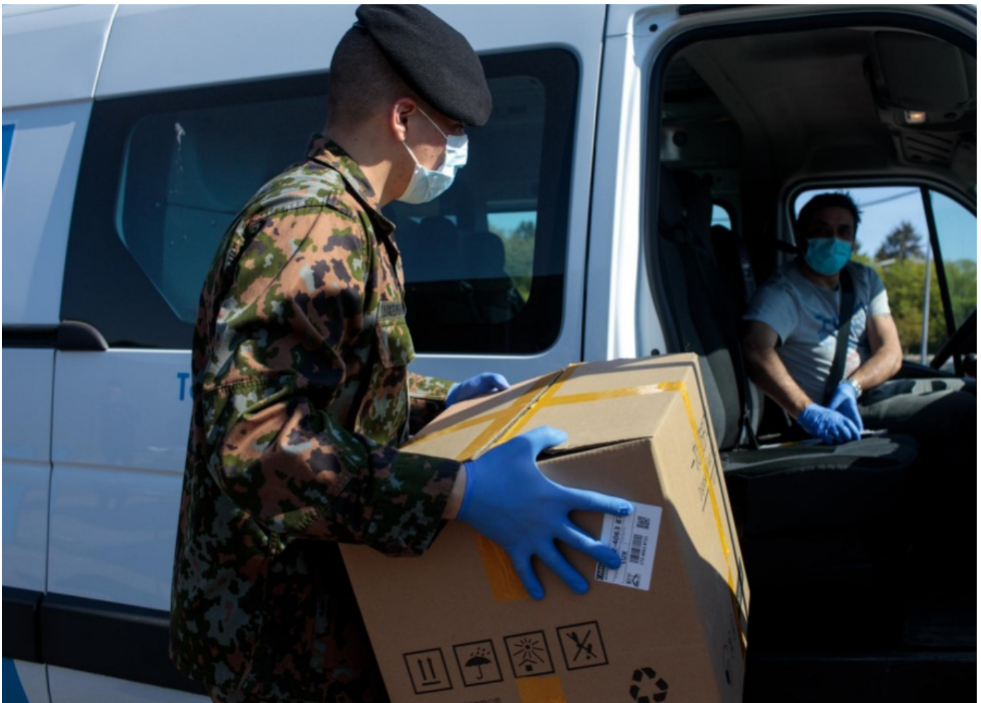
Remise de masques aux entreprises de l'artisanat

Publié Le 17.04.2020 • Édité Le 17.04.2020